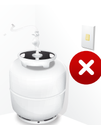
Instalação próxima a fontes de ignição

Não guarde nem use o botijão deitado ou de cabeça para baixo.