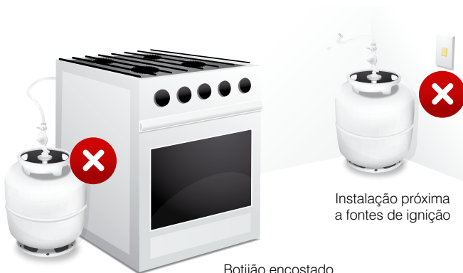
Botijão encostado no fogão

Afaste o botijão no mínimo 1,5 m de ralos, caixas de gordura e de esgoto. Em caso de vazamento, o gás é mais pesado do que o ar e tende a se concentrar nos locais mais baixos, podendo se acumular em tubulações.